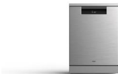
Haier I-Pro Shine (2)