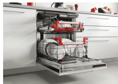
H-DISH 700 PRO (2)