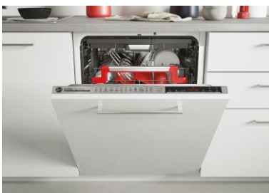
H-DISH 700 PRO (2)