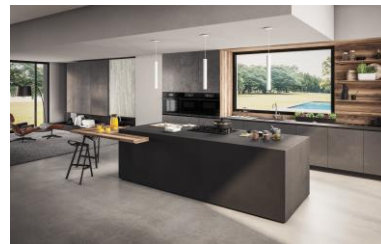
Haier Chef@Home Serie 6 (4)