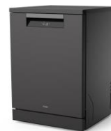
Haier I-Pro Shine (4)