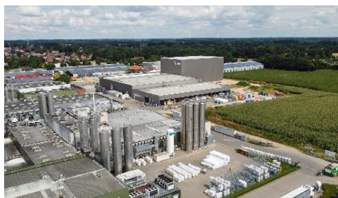
Neues Service- und Logistikzentrum in Visbek