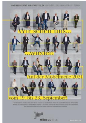
MÖBELMEILE Messe-Guide Gruppenbild