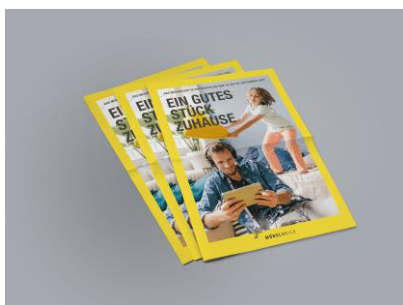
MÖBELMEILE Messe-Guide Mockup