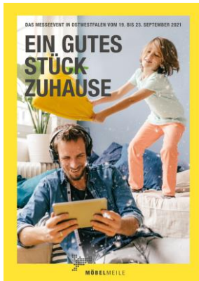
MÖBELMEILE Messe-Guide 2021 Titel