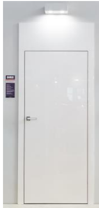
REHAU_SICAM_2019_5_Innentuer_ RAUVISIO_brilliant_Hochglanz_ CopyrightbyDRE