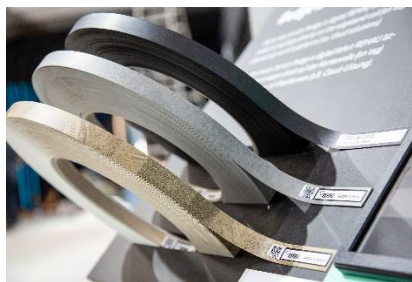
REHAU_SICAM_2019_3_ #edge is digital